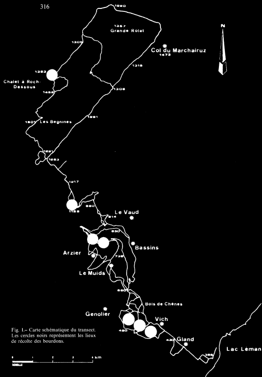
Fig. 1.- Carte schématique du transect. Les cercles noirs représentent les lieux de récolte des bourdons.